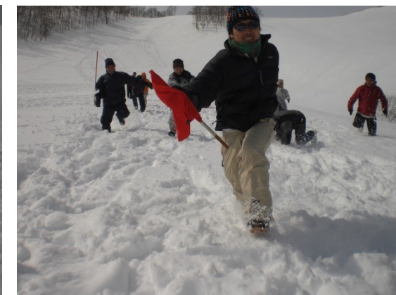
上記は「羅臼町営スキー場」で開催した際の「雪上ティーボール」・「スノーフラッグ」の様子です。